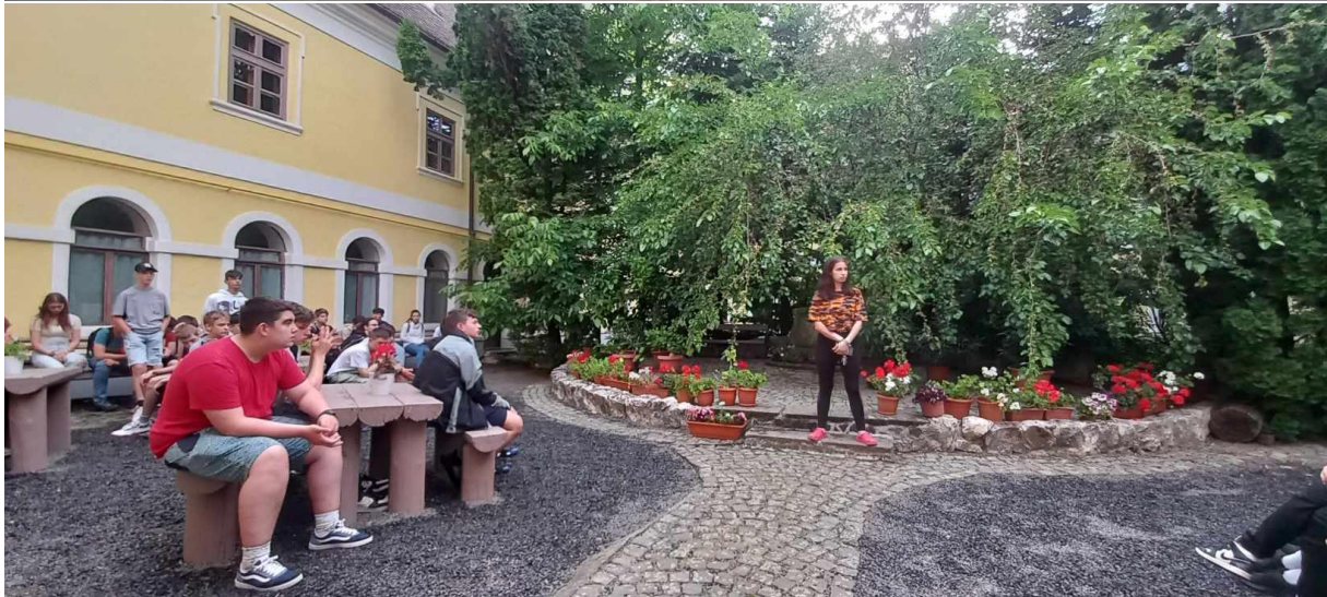
Szállás, vacsora Herkulesfürdőn.